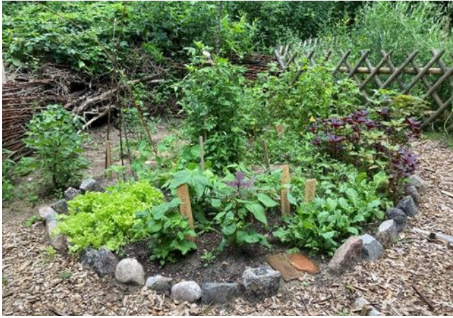
Miniaturwaldgarten am 02.07.2023