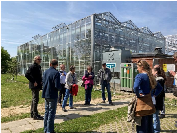
Exkursion zu den Versuchsgewächshäusern in Dahlem