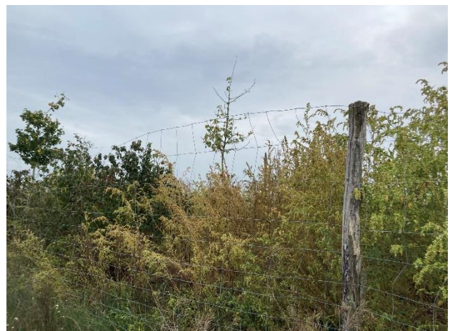
Hohe Wildkräuter im Bestand, viel Melde in der Feldhecke