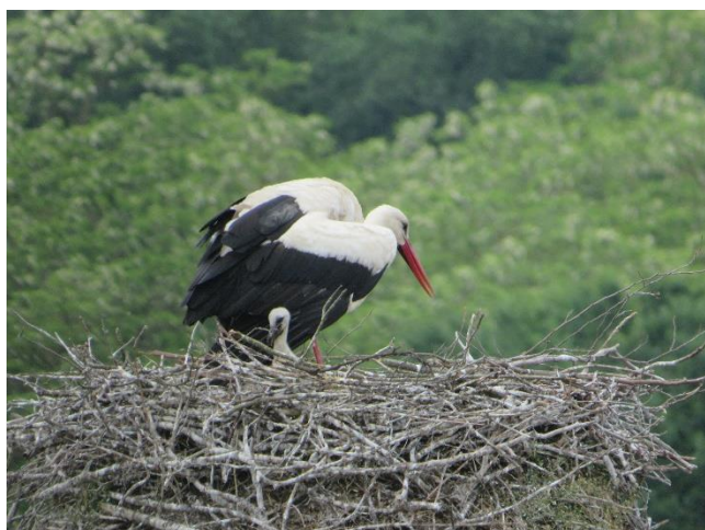
6.Juni 23: Meist sieht man nur 1 Küken