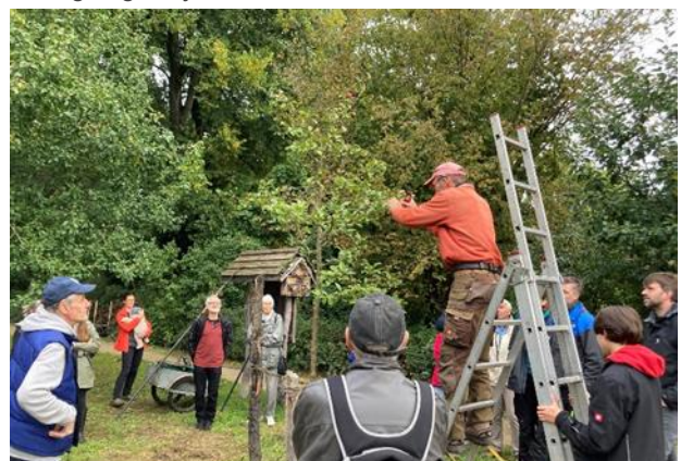
13.10.: Obstbauseminar auf der Streuobstwiese