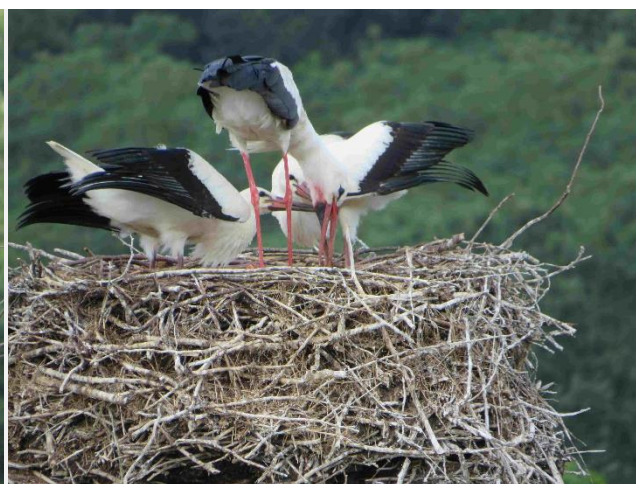
4.August 23: Noch sind die Störche da