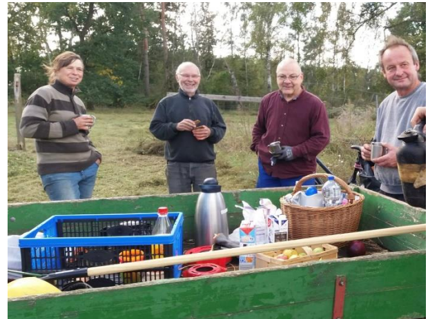
Endlich ist die Orchideenwiese fertig

Das feuchte Frühjahr 2023 hat den Wuchs der Feldhecke gefördert. Am 17.3. wurde Holzhäcksel als Mulch ausgebracht. Zur Verbesserung des C/N-Verhältnisses wurden Hornspäne verteilt. Die Feldhecke stabilisiert sich zu großen Teilen erfreulich. Hohe Beikräuter wurden in zwei Arbeitseinsätzen am 14.10. und 11.11. mit Hand und Sichel entfernt, um Konkurrenz zu den z.T. noch kleinen Gehölzen zu vermeiden. Auf umfangreiche Einbringung von Laub wird in diesem Jahr verzichtet.