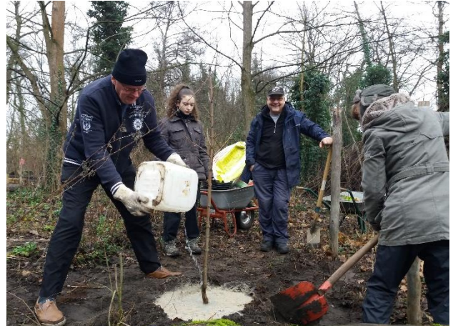
Pflanzung von Bäumen und Sträuchern im November 23