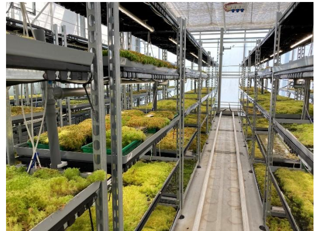
Versuche zur Kultur von Torfmoos für gärtnerische Substrate