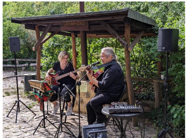
Für tolle Hintergrundmusik sorgte das Duo „Lovely Soul“ aus Schöneiche