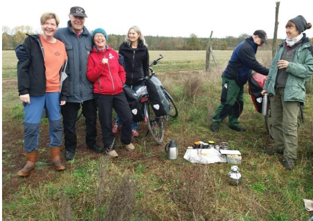
Alles geschafft am 11.11. um 11:11 Uhr