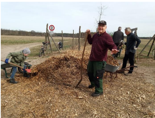
Holz hackschnitzel wird verteilt