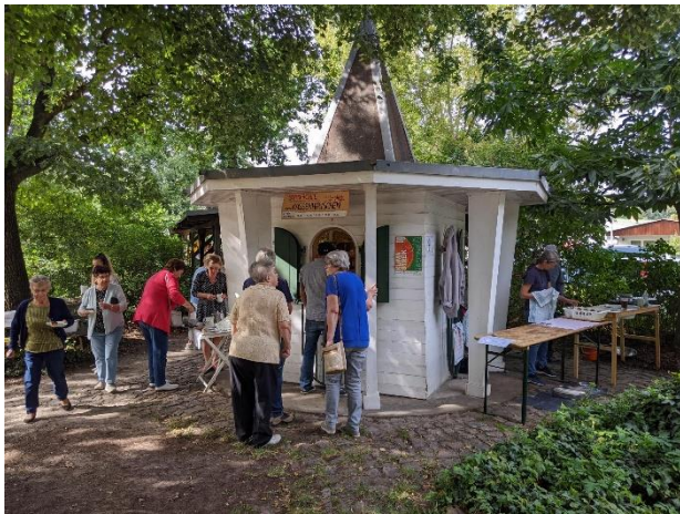
Sommercafé 2023 – stets sehr gut besucht

Mit den Cafés wurden in diesem Jahr Spendeneinnahmen in Höhe von 3.514,75 € erzielt, die für die Naturschutzarbeit des Vereins verwendet werden.