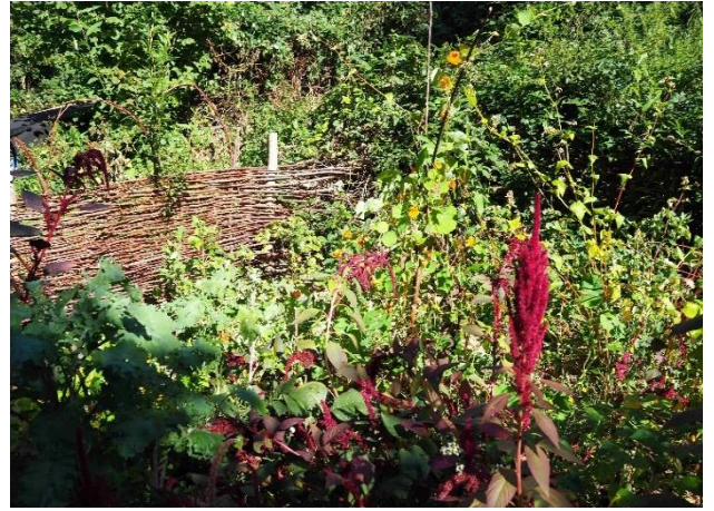
Mit Weidenzauneinfassung und reicher Ernte Sept. 2023