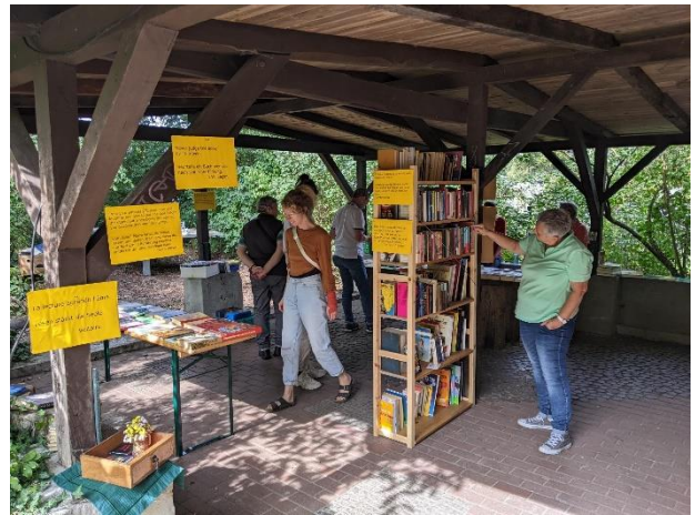
Ein liebevoll eingerichtetes Antiquariat erfreut die Besucher