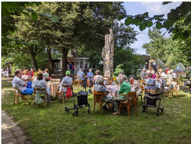
Oft waren alle Tische besetzt und das Geschirr wurde knapp